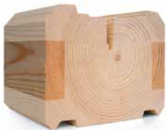
ПРОФИЛИРОВАННЫЙ БРУС КАМЕРНОЙ СУШКИ