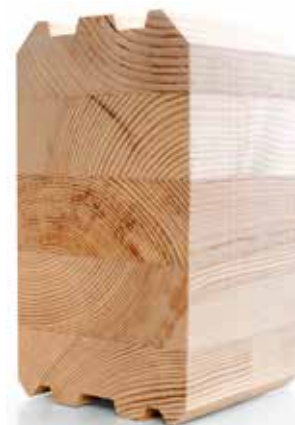
«ДЫШАЩАЯ» ЭКО СТЕНА